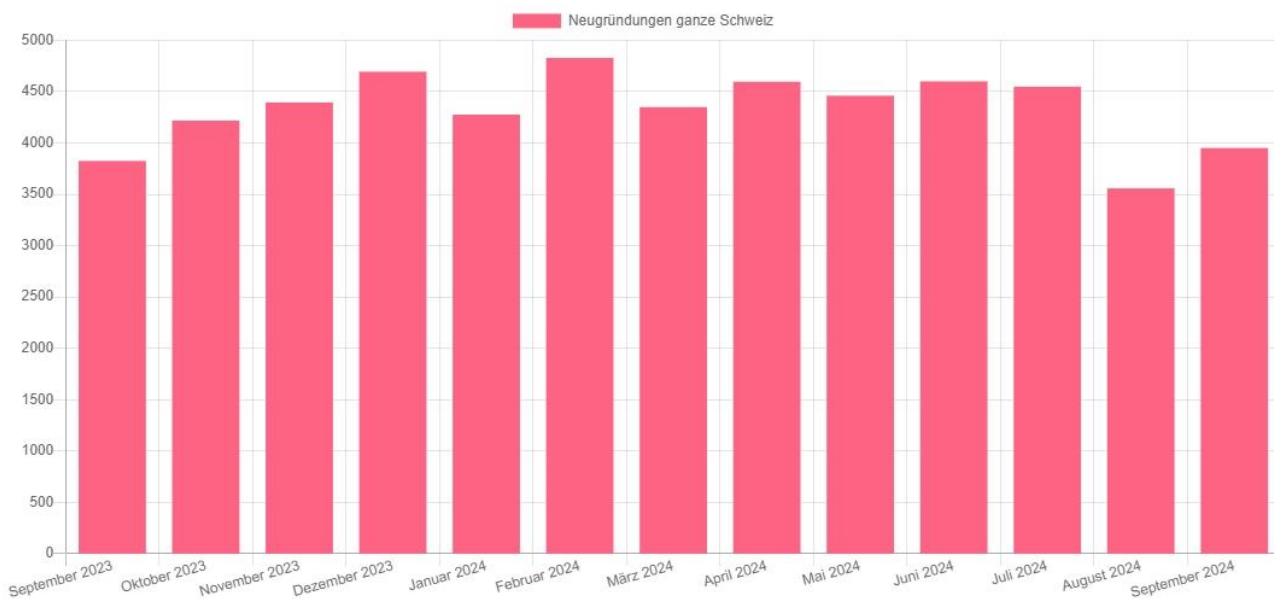
Firmen-Neugründungen September 2023 bis September 2024

Der August war von einer Sommerflaute geprägt, doch gegen Ende des Monats zeigt der September wieder steigende Zahlen. Insgesamt wurden 3'951 Neueintragungen registriert, was einem Zuwachs von 11 % gegenüber dem Vormonat entspricht. Im Vergleich zum Juli 2024 verzeichnet der September jedoch einen Rückgang von 13 %. Vergleicht man die Zahlen mit dem Vorjahr, ist die Entwicklung jedoch positiv, mit einem Plus von 3,3 %.