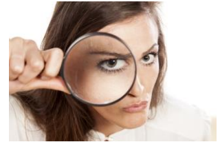
Lösungen für Kommunen